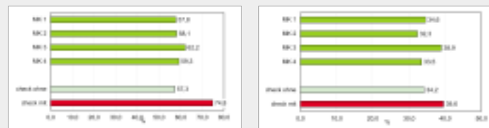
Feldversuch 2004: Aufgang von Zuckerrüben. Behandlung der Pillen mit Bakterienstammes Pseudomonas sp., Isolat BA2002. Formulierung als Mikro kapseln: MK1 = Guargum MG, MK2 = Alginat SP, MK3 = Pektin PA, MK4 = Guargum MF. check ohne: Applikation ohne Bakterien, ohne chemische Beizmittel, check mit: Standard-Applikation mit chemischen Beizmitteln. Früher Aufgang (links) und Endaufgang (rechts) am Standort Hilprechtshausen, Parzellenversuch, 4 Wdh.

Neuartige Kapselsysteme, die während des Projektes entwickelt wurden, zeigen gegenüber den herkömmlichen Alginatkapseln verbesserte Wirkung.