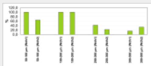
Wiederfindung unterschiedlicher Größen von Alginat-Mikro kapseln nach Einarbeitung in ZR-Pillen (% von theoretischer Menge).

Versuche zur Integration von Mikro kapseln unterschiedlicher Größe in den KWS-Standard-Pillierprozess machten deutlich, daß sich Kapseln des Durchmessers 100–200 µm als Hüllmassenbestandteile eignen. Die Produktion dieser definierten Kapseln ist mit der neuartigen Strahlschneidertechnologie möglich.